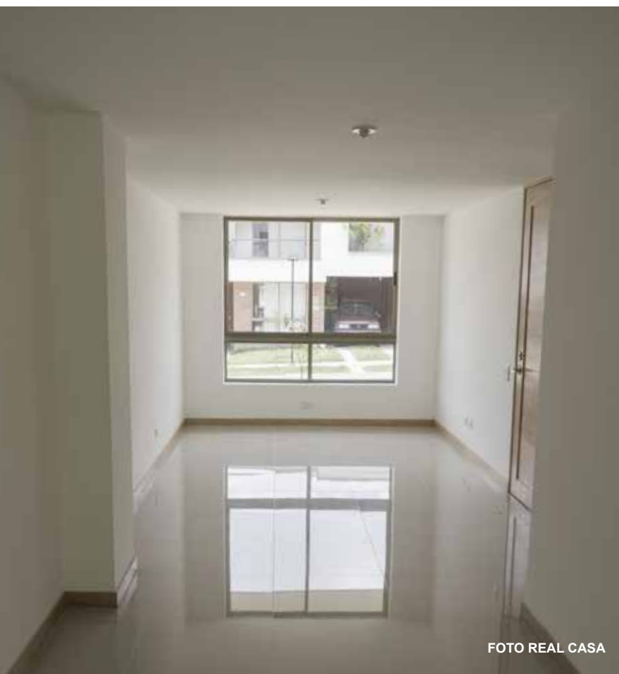
FOTO REAL CASA