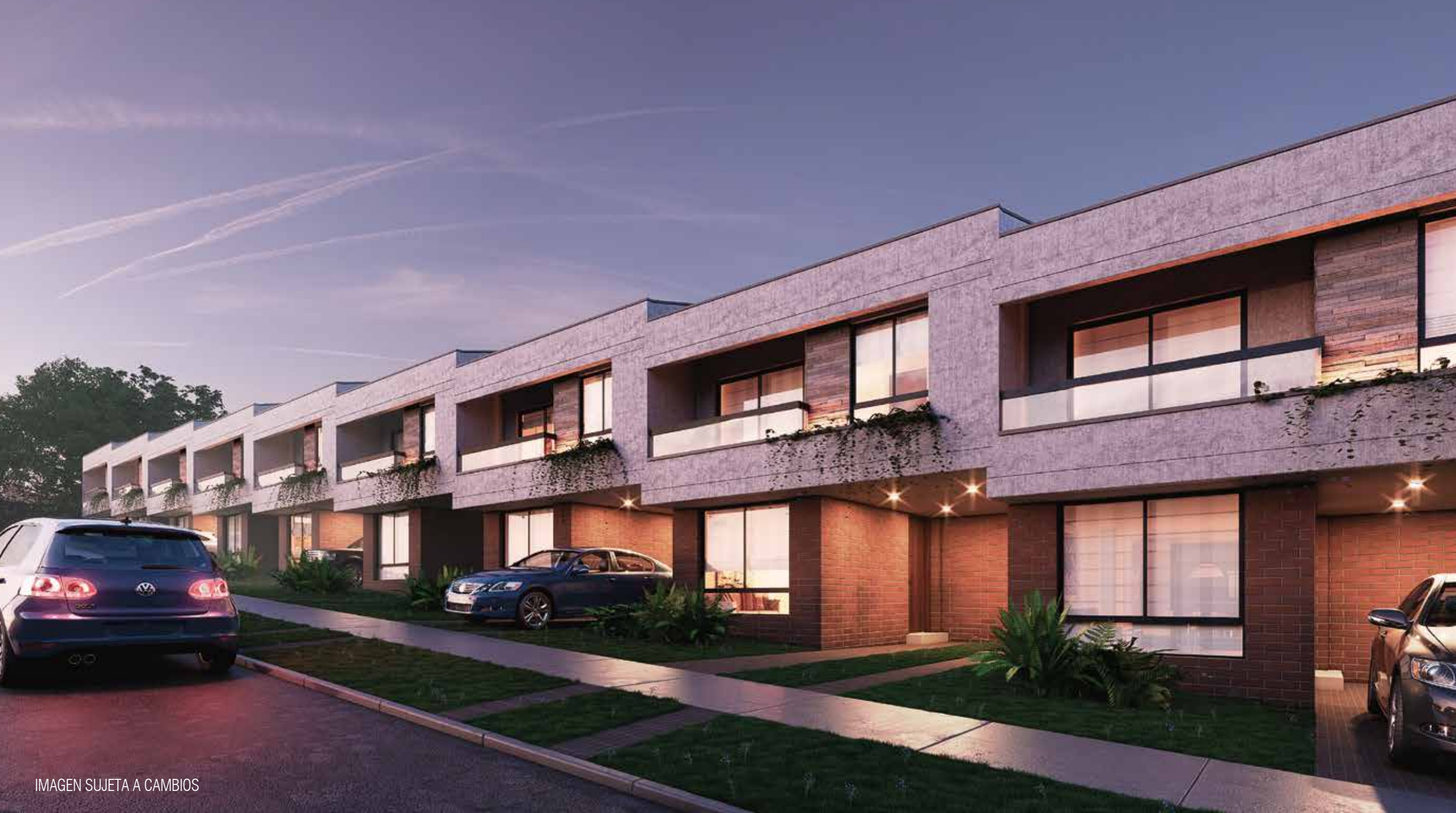
IMAGEN SUJETA A CAMBIOS