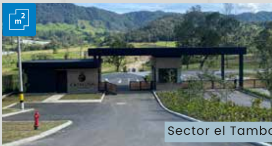
Sector el Tambo