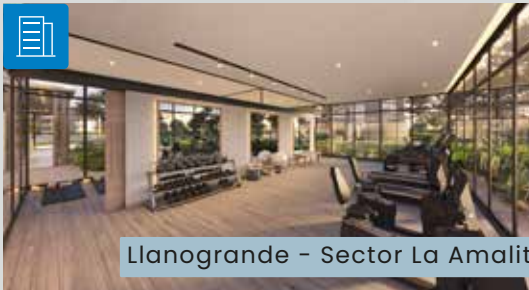
Llanogrande - Sector La Amalita