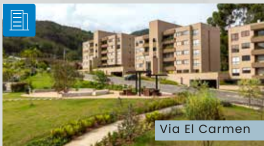
Via El Carmen