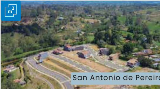
San Antonio de Pereira