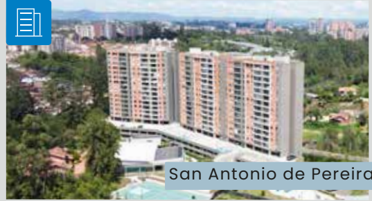
San Antonio de Pereira