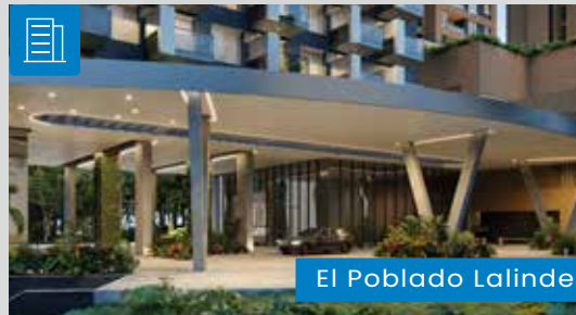
El Poblado Lalinde