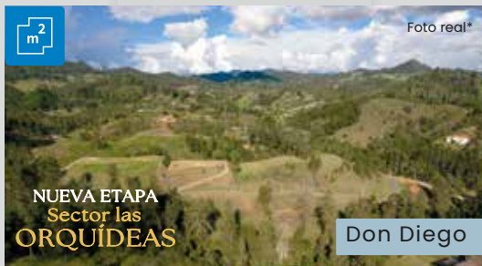
NUEVA ETAPA Sector las ORQUÍDEAS