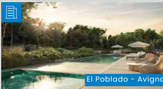
El Poblado - Avignon